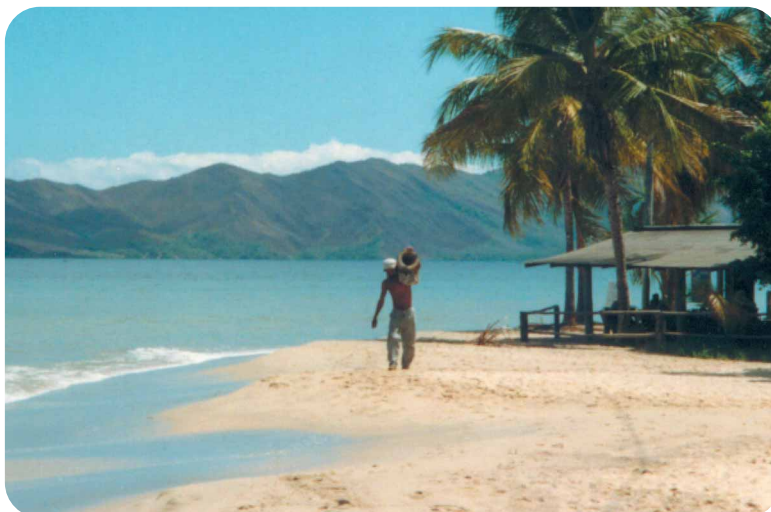
Sopra un pescatore sulla spiaggia di Santa Fe, nella pagina accanto la cascata del Santo Angel, la piu' alta del mondo.

Alla stazione di arrivo dell'autobus in tanti vi avvicineranno per proporvi questa escursione.